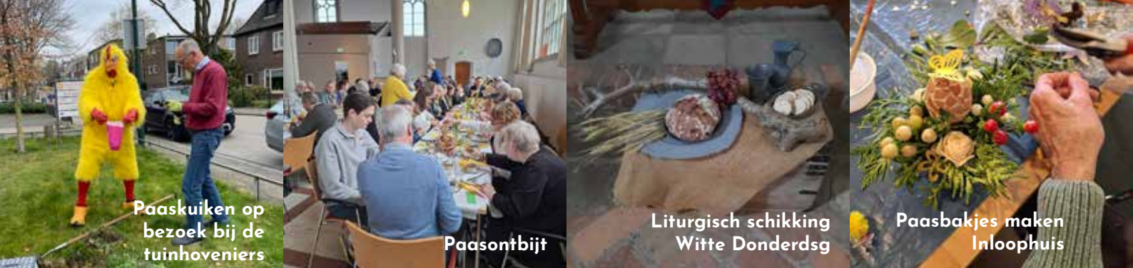
Paaskuiken op bezoek bij de tuinhoveniers