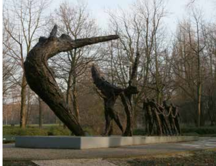
Slavernij monument Oosterpark Amsterdam fotograaf: Erwin de Vries - 2002 - Arthens

Na de viering in de Vredebergkerk zijn we welkom op het plein voor de Bernulphuskerk voor de jaarlijkse Pinkstermanifestatie, georganiseerd door de Raad van Kerken: buiten op het plein, gewoon aan de straat, in het midden van de gemeenschap, met mensen uit andere kerken en misschien ook met voorbijgangers. Er is ruimte voor goede woorden, voor vrolijke pinksterliederen en voor ontmoeting.